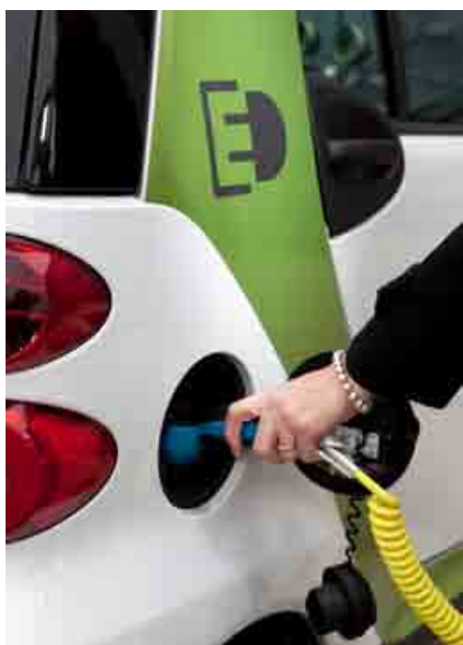
Hlavným prínosom spolupráce HP Slovakia a Arval Slovakia je zníženie emisií CO 2 o 169,5 ton.

dodávateľ, spoločnosť ProCS, spoločnú platformu na vzájomnú výmenu skúseností. Na prvom stretnutí v apríli 2012 spoločne diskutovali o problematike BOZP a o novom predpise na zabezpečovanie BOZP na staveniskách ProCS. Vzájomná spolupráca v dodávateľsko-odberateľskom vzťahu prináša účinné riešenia.