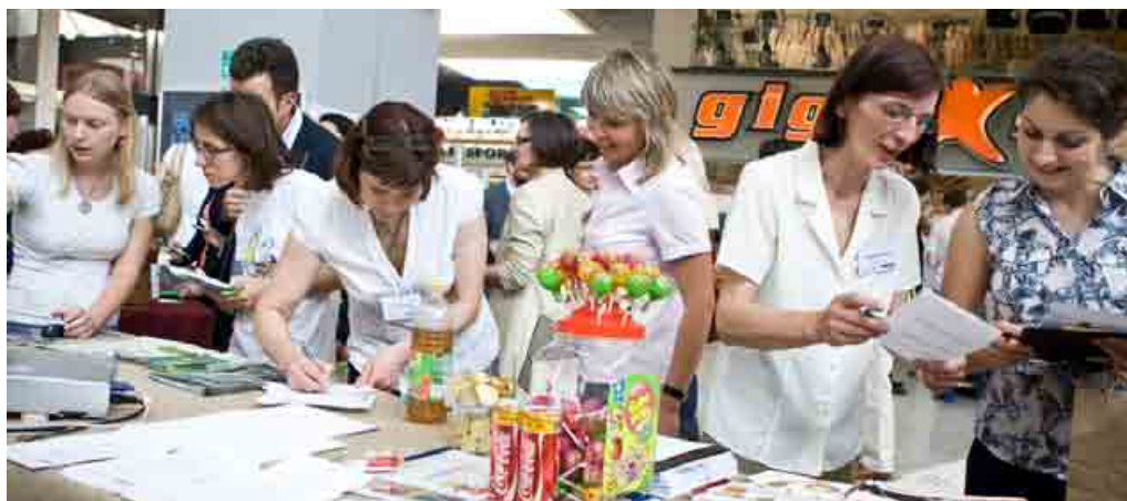
Na Trhovisku zodpovedných firiem si stánky prezrelo viac než 300 ľudí. Najrušnejšie bolo pri stánku spoločnosti Provident Financial.