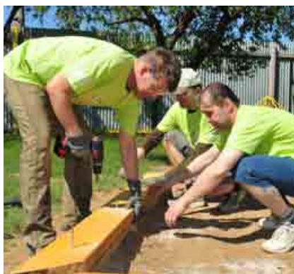
Firemné Dni dobrovoľníkov spoločnosti U.S. Steel sa konali už šiesty rok.