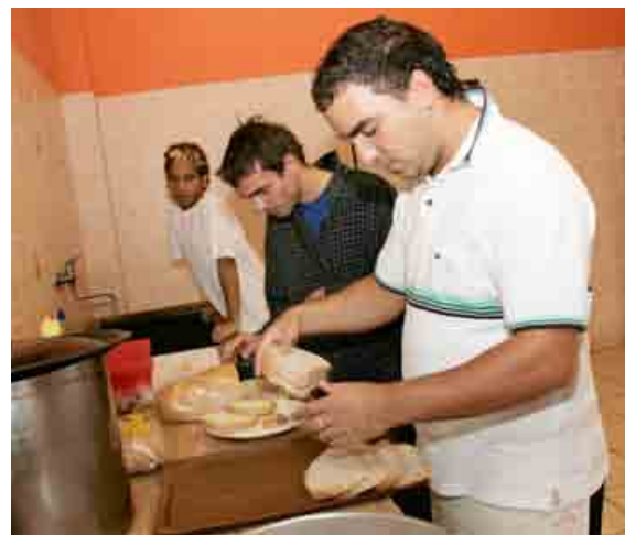
Chlapci z Domu na polceste čoskoro rozbehnú projekt poľnohospodárskej farmy.