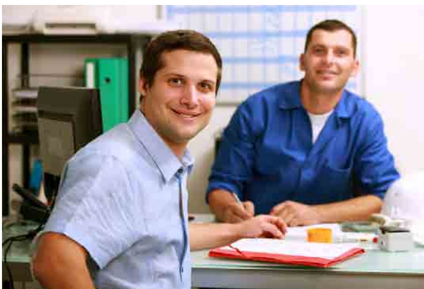
Spoločné projekty smerujú k zlepšeniu dodávateľsko-odberateľských vzťahov.

vateľských malých a stredných firiem analyzovaných podľa britskej metódy European Foundation for Quality Management. Stratégie zodpovedného podnikania pre spomínané firmy boli pripravené v spolupráci so študentmi a pedagógmi Ekonomickej univerzity v Bratislave. Obzvlášť cenné sú spoločné dodávateľsko-odberateľské riešenia pre aktuálne témy v oblasti zodpovedného podnikania.