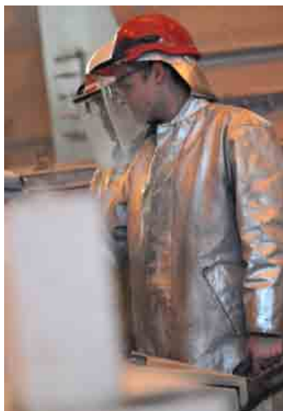
Spoločnosť Slovalco a jej dodávateľ Remeslo strojal sa zamerali na spoluprácu v oblasti BOZP.

Dlhodobým a spoľahlivým dodávateľom Východoslovenskej energetiky je spoločnosť Slavstroj, ktorá sa môže pochváliť kvalitnými procesmi s certifikátom podľa normy ISO 9001. Partneri si spoločne vytypovali oblasť BOZP, pričom zamestnanci Východoslovenskej energetiky vykonali komplexný audit