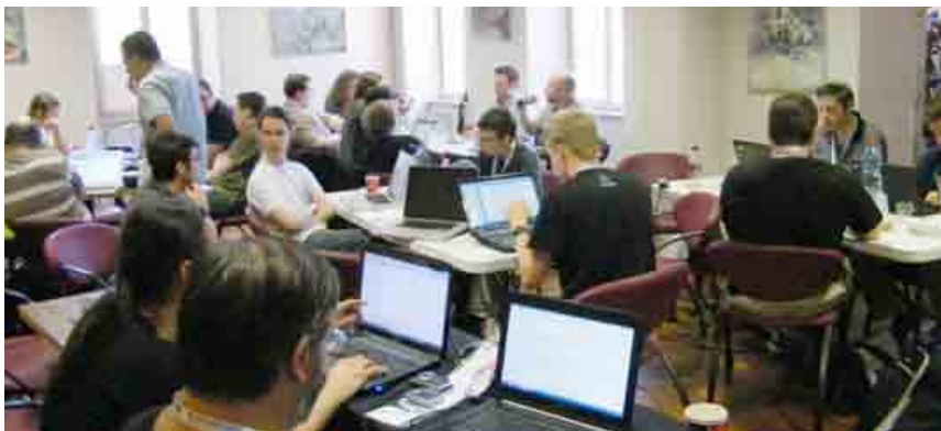
Nový e-learningový nástroj nájdete na stránke zodpovednepodnikanie.sk

Po správnom zodpovedaní otázok v záverečnom teste si budú môcť používatelia vytlačiť certifikát, ktorý im osvedčí úspešné absolvovanie testu. Veríme, že oba nástroje prispievajú k rozširovaniu znalostí o zodpovednom podnikaní na Slovensku. Pre budúcich manažérov priamo na škole a pre už zabehnutých alebo začínajúcich podnikateľov prostredníctvom moderných metód e-learningu. «