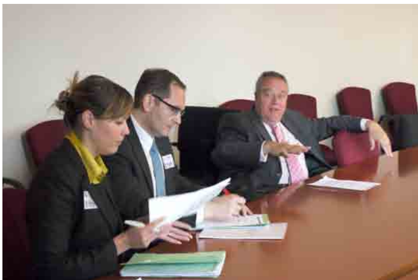
Stretnutie delegácie s členom Európskeho parlamentu Richardom Howittom (vpravo), ktorý je zodpovedný za agendu zodpovedného podnikania.