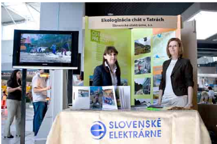
Za najlepší stánok na Trhovisku zodpovedných firiem účastníci vyhodnotili stánok Slovenských elektrární, člena skupiny Enel.

Konferenciu mediálne podporili Hospodárske noviny, Týždeň, Trend, Forbes, Profit, TASR, Euractiv.sk, HNonline.sk, SITA, Webnoviny.sk, Podnikam.sk, Stratégie, Goodwill, Slovak Spectator, Zodpovednepodnikanie.sk a Instore. «