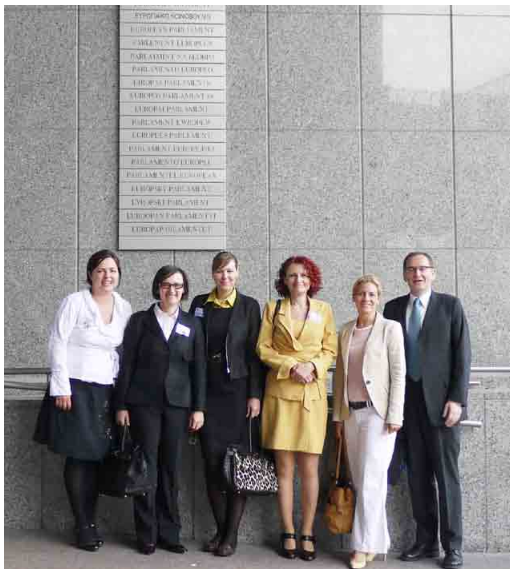
Slovenská delegácia pred budovou Európskeho parlamentu.

Slovensko je jedna zo siedmich krajín zapojených do projektu FOOD. Ak reštaurácia na Slovensku dodržiava aspoň šesť z dvanástich odporúčaní, danej reštaurácii je udelený certifikát FOOD. O tom sú informovaní zákazníci, aby vedeli, že sa stravujú v reštaurácii zdravého stravovania.