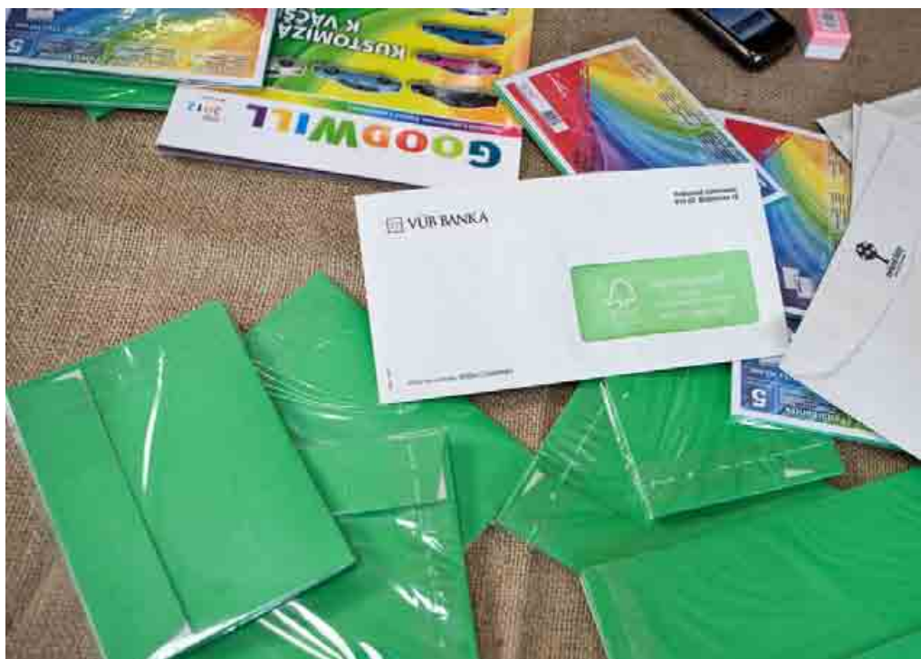
VÚB banka a Harmanec Kuvert spolupracujú na dodávkach ekologických obálok.

Na známom letnom projekte Magio pláž spolupracuje Slovak Telekom s dodávateľskou agentúrou Institute of Promotion už štvrtý rok. Minulé leto bola práve táto mestská pláž dejiskom týždňového podujatia s názvom Nesieme zodpovednosť, kde sa mohli návštevníci dozvedieť veľa zaujímavých informácií a rád z oblasti zodpovedného podnikania. Súčasťou podujatia bola aj výstava fotografií z realizácie projektov zodpovedného podnikania spoločnosti Slovak Telekom. «