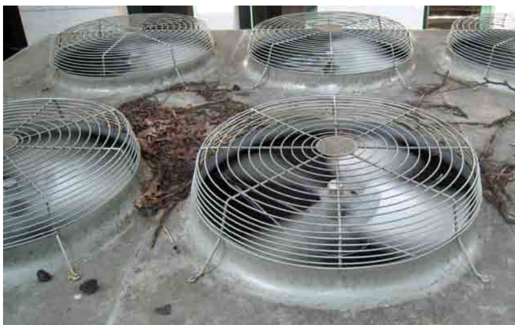
Klimatizačná jednotka nastavená na 26 stupňov nám zaistí efektívnejšiu spotrebu energie.

Existuje však aj názor, že pozitívne pokroky v oblasti energetickej efektivity sa môžu stať prekážkou pri zvyšovaní kvality vzduchu v interiéri, a tak vznikajú protichodné ciele. Východiskom by mali byť zdravotné štandardy pre ventilačné systémy v priestoroch škôlok, škôl a kancelárií so súčasným zaistením efektívnej spotreby energie. Európska komisia zatiaľ o tento projekt nejaví veľký záujem a hovorí, že zodpovednosť leží na pleciach členských štátov. Je však isté, že bez širokej podpory na najvyšších miestach projekt nemá šancu stať sa účinným. «