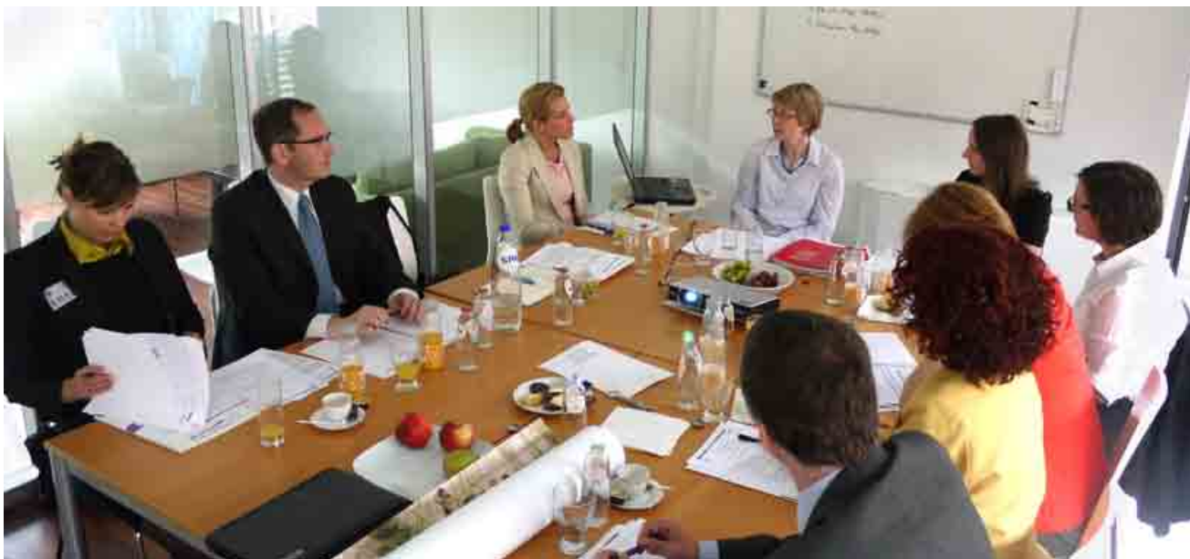
Diskusia so zástupkyňou malej belgickej tlačiarne Artoos (v strede).

Žiaľ, podpora zodpovedného podnikania na Slovensku je odlišná napríklad od tej belgickej. Účastníci delegácie sa mali možnosť presvedčiť od zamestnanca malej belgickej tlačiarne Artoos, akú podporu firma dostala od štátu na svojej ceste k zodpovednému podnikaniu. Či už to bola finančná podpora na nákup solárnych kolektorov, podporu zamestnávania ľudí nad 50 rokov, či na vydanie firemnej správy o zodpovednom podnikaní. Malá belgická tlačiareň je motivovaná neustále sa zlepšovať nielen